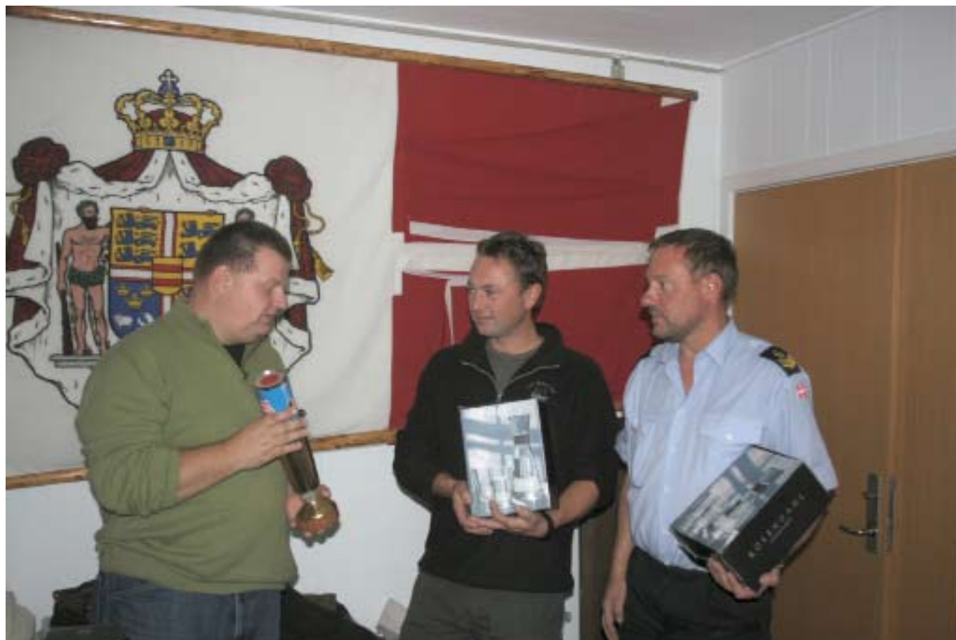
2 af ynglinge besætningens medlemmer